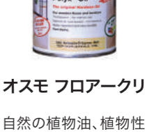
オスモ フロアークリアーエクスプレス 床用クリアー#3362 つや消し

自然の植物油、植物性ワックスから作られた仕上げ用塗料で、撥水性にすぐれ汚れを防止します。