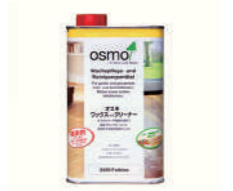
オスモ ワックスアンドクリーナー 床用ワックス

自然のワックスをベースに作られています。頑固な汚れも落とすことができ、艶・撥水効果がよみがえります。缶をよく振ってから量1〜2枚の面積に少量、目地を避けてぼたぼたと垂らし(1㎡に小さじ2杯程度、量1枚の広さに小さじ3〜4杯)、直後に乾いたモップや雑巾で薄く塗り広げます。