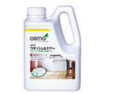
オスモ ウォッシュアンドケアー 床用メンテナンス洗剤

自然の植物油からできた肌と環境にやさしい洗浄液で、掃除とメンテナンスを一度に行うことができます。塗装を強くする働きもあります。キャップ1杯(10cc)を1Lの水に溶かして使用します。雑巾やモップは十分に絞ってください。2度拭き不要で、約15分で乾きます。