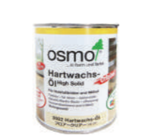
オスモ フロアークリアー 床用クリアー#3062 つや消し

表面が白くなってきた段階を目安に、建設会社に見てもらうことをお勧めしています。再塗装が必要な場合、オスモカラーフロアークリアー(つや消し)、オスモカラーフロアークリアーエクスプレス(つや消し)をご使用ください。